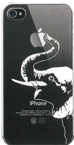
アフリカゾウ EWF P 0 1 U M