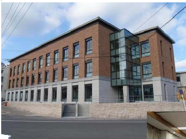
金沢地方裁判所・金沢家庭裁判 所七尾支部・七尾簡易裁判所