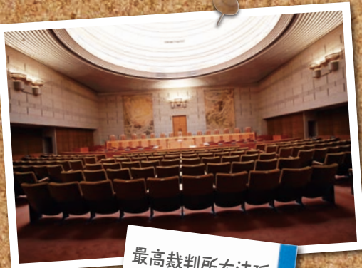
最高裁判所大法廷