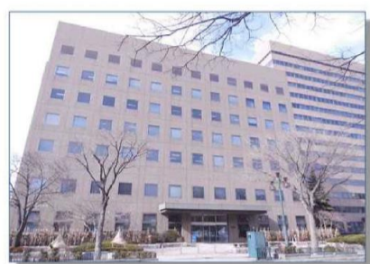
札幌簡易裁判所外観(大通公園側)