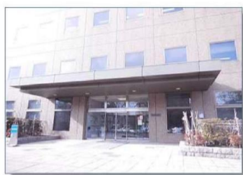
札幌簡易裁判所 正面玄関前