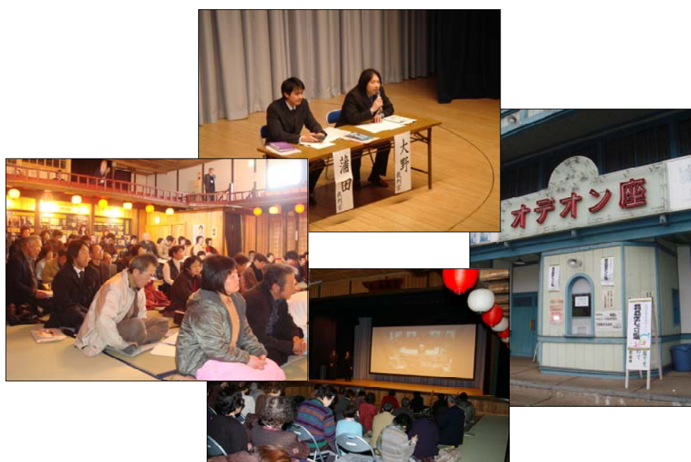
美馬市オデオン座での映画上映会と意見交換会 ～平成20年1月20日（日）開催～