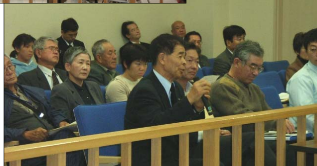
松山地裁宇和島支部での模擬裁判と意見交換会 ～平成19年12月1日(日)開催～