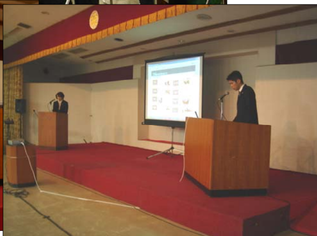
安芸市総合社会福祉センターでの映画上映会と意見交換会 ～平成20年2月2日(土)開催～