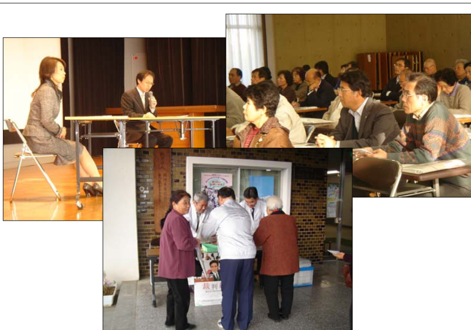
東かがわ市中央公民館での映画上映会と意見交換会 ～平成19年12月1日（日）開催～

ミニフォーラムでは、最高裁判所が広報用として製作した裁判員映画の上映会やパネリストを交えた意見交換会、さらには裁判員裁判を想定した模擬裁判などを行っています。