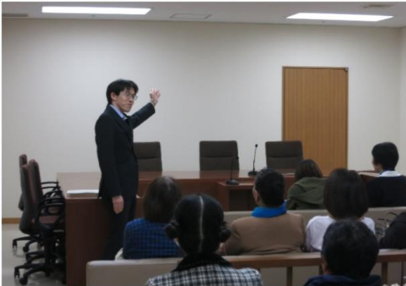
少年審判廷の見学風景