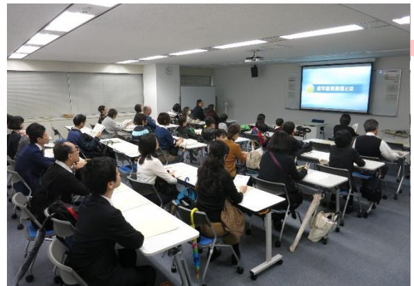
成年後見制度に関するDVD視聴