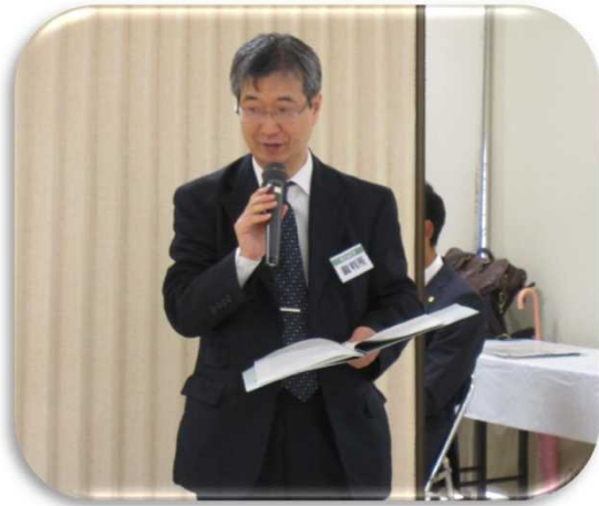
▲ 制度の説明を行う津簡易裁判所職員