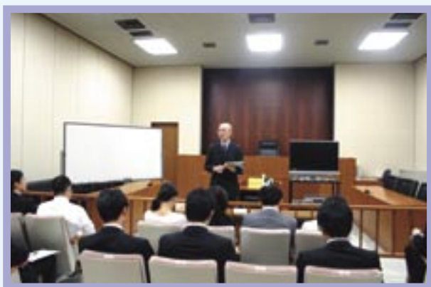
【オリエンテーション】

選ばれた裁判員役の方には、宣誓をしていただき、その当日から模擬裁判の審理に参加してもらいました。