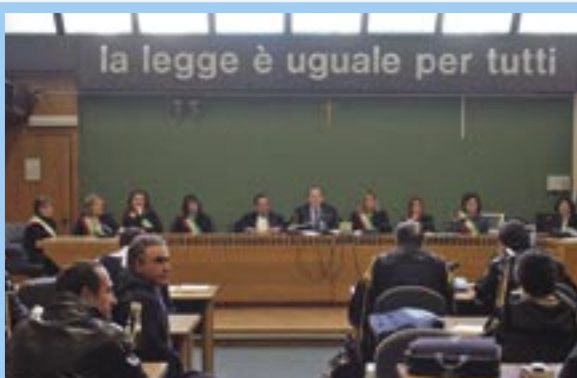
【写真Ⅰーナポリ重罪院における公判風景】

人数構成の点です。イタリアのそれは 参審員6名と裁判官2名 という構成で、日本の裁判員制度より裁判官の数が1名少ないだけです。写真Ⅰは、ナポリの裁判所における公判風景ですが、真ん中に裁判官が座り、その左右に参審員（たすきを付けている人たち）が3人ずつ座る様子は、日本の裁判員制度のイメージそのままです（ただし、写真Ⅰでは、補充参審員1名と速記官も一緒に座っています。）。