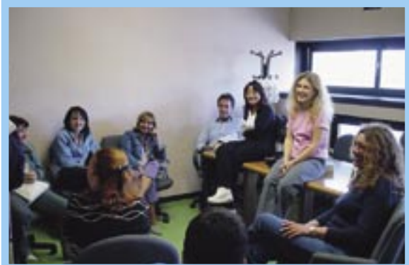
【写真Ⅲーナポリ重罪院における参審員と裁判官の雑談風景】