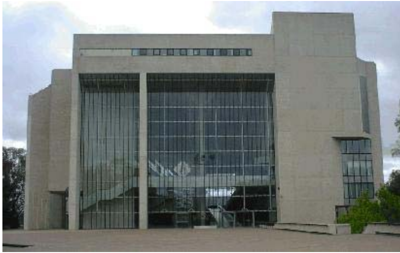
オーストラリア連邦最高裁判所ビル（キャンベラ）