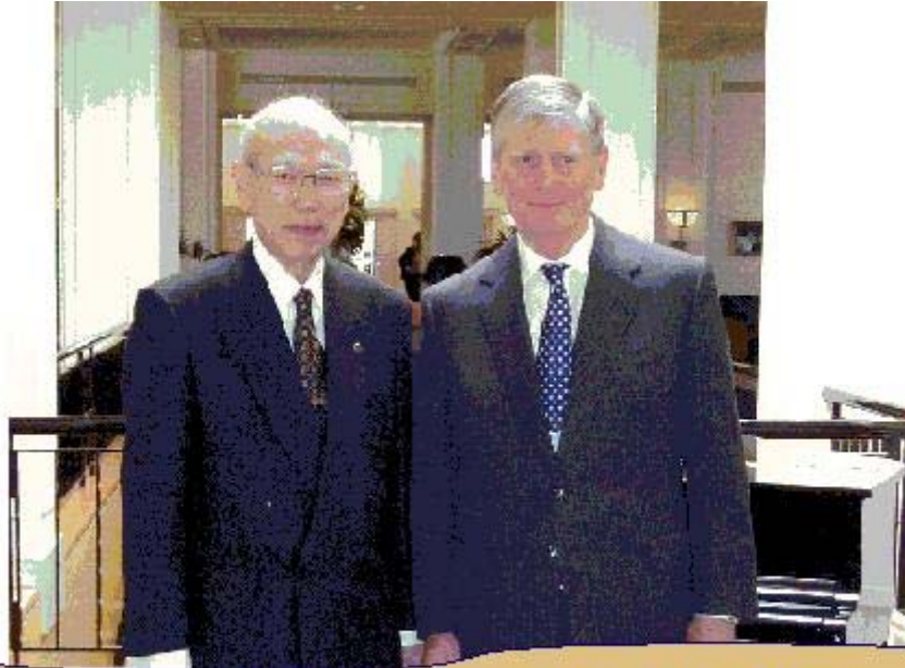
町田顯最高裁判所長官 と オーストラリア連邦最高裁判所 アンソニー・マレー・グリーンソン長官