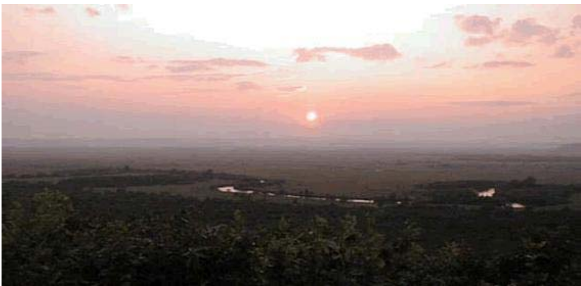
夕暮れの釧路湿原

このように、道東地方は厳しい経済状況下にあります。景気が回復し、再びかつての活況を呈することを願いつつ、日々の事件処理を行っています。