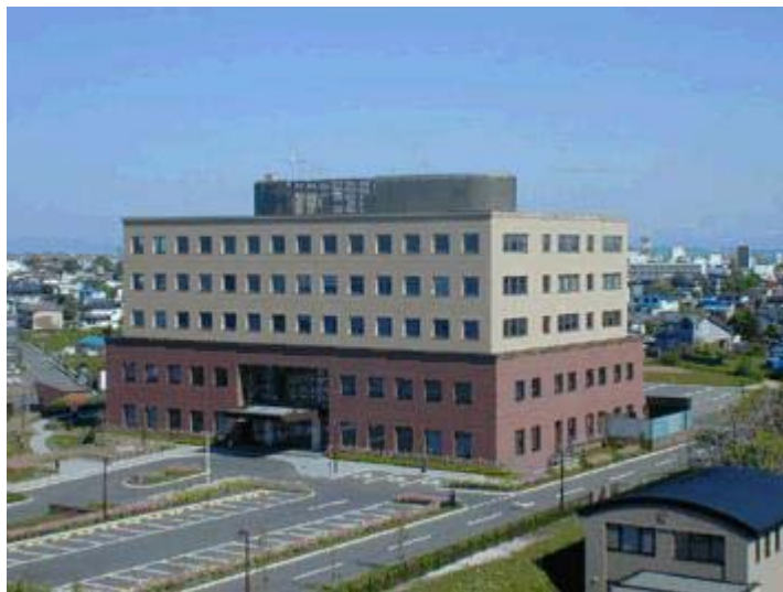
釧路地方・家庭裁判所本庁庁舎

また、道東地方は、地震の多い地域としても知られています。今年9月26日には、『平成15年(2003年)十勝沖地震』があり、道東地方・日高地方をはじめ北海道各地に大きな被害をもたらしました。道東地方の強い地震は、古文書などにも記録があるほか、昭和27年と昭和43年の十勝沖地震、昭和48年の根室沖地震、平成5年の釧路沖地震、平成6年の北海道東方沖地震と頻発しています。釧路地方・家庭裁判所本庁旧庁舎も平成5年と平成6年の2度の地震により大きな被害を受け、これを契機として平成13年4月に庁舎を建て替えました。新庁舎建築にあたっては、地震の被害を最小限に食い止めるために、裁判所としては全国で初めて、建物基礎部分に「免震」基礎工法が採用されました。