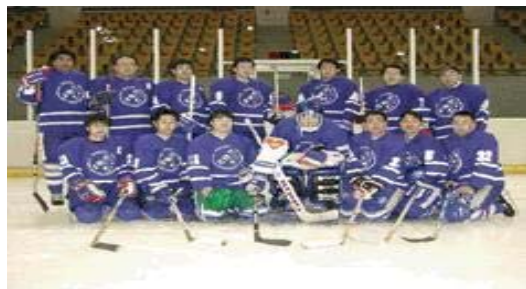
アイスホッケー部一同

に加盟しており、シーズンには熱い戦いが繰り広げられ、市民の皆さんとの交流も活発に行われています。