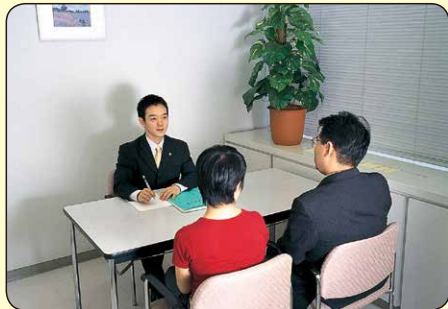
少年・保護者に対する面接調査（イメージ）

家庭裁判所調査官は、心理学、教育学などの専門知識をいかして、少年や保護者、その他の関係者と面接をするなどして、非行の原因や少年の抱える問題について調査します。