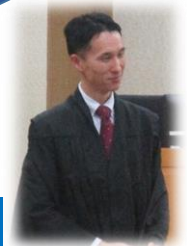
山形地裁 島田裁判官