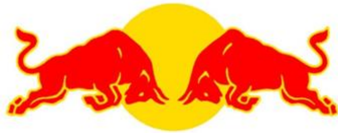
【使用商標 2 - 引用商標】