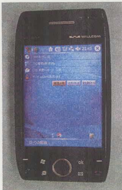
図 4 の 1