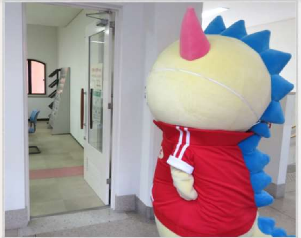
「おじゃまするはぴ〜」

かんいさいばんしょしょきかんしつ ぞじょう では、 みんじちやうていどう 訴状や民事調停等 の書 しょめん 面 ていしゅつ の提出 てつづき をすることができるほか、手続 あんない 案内 おこな を行っています。