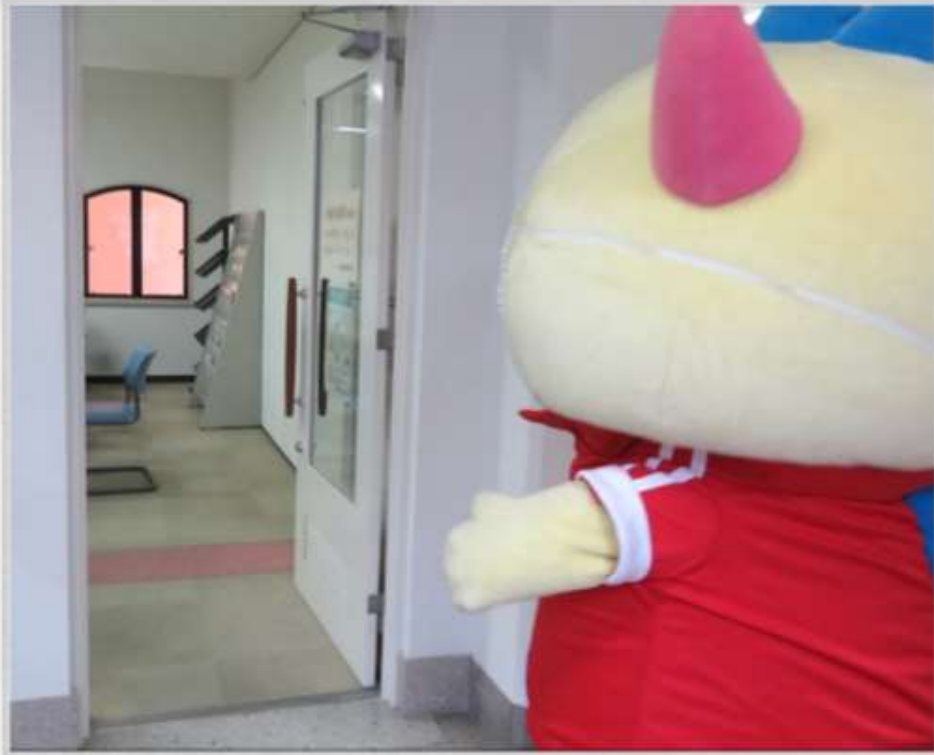
かんいさいばんしょ はい に入るはぴりゅう

かんいさいばんしょしょきかんしつ ぞじょう では、 みんじちやうていどう 訴状や民事調停等 の書 しょめん 面 ていしゅつ の提出 てつづき をすることができるほか、手続 あんない 案内 おこな を行っています。