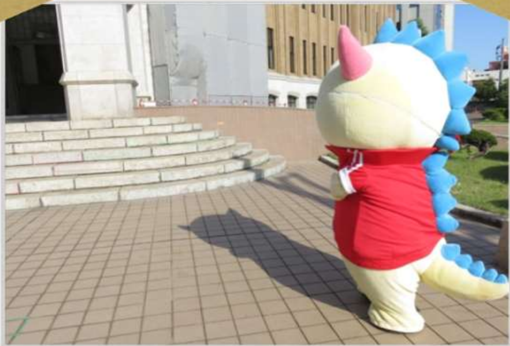
しょうめんげんかん む 正面玄関に向かうはぴりゅう