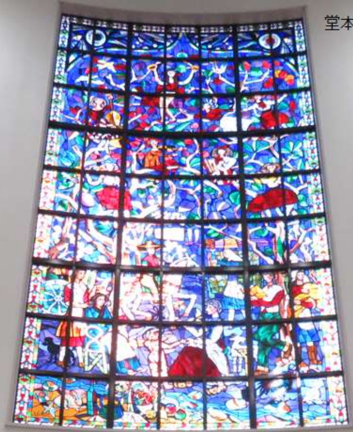
堂本印象画伯「楽園」