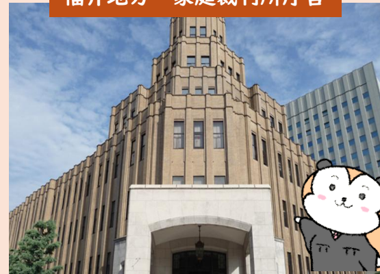
福井地方・家庭裁判所庁舎