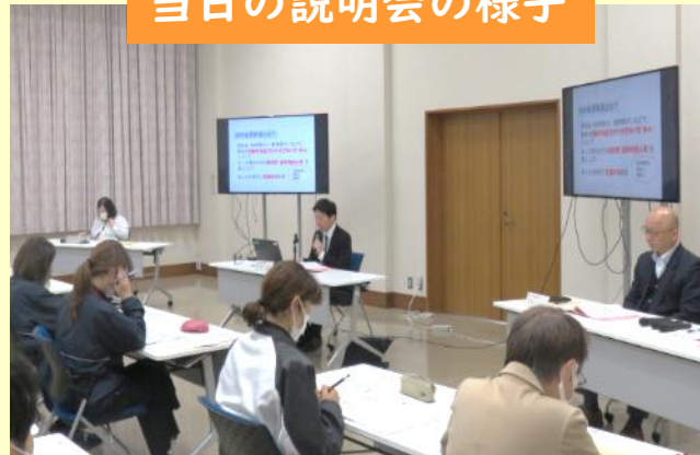
当日の説明会の様子

説明後は質疑応答の時間も設け、参加者からは、「 成年後見人の報酬は？ 」「 市民後見人の育成についてもっと詳しく聞きたい 」など、普段から疑問に思っていることについて多くの質問が寄せられました！