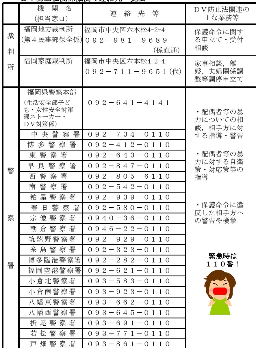
DV防止法関係機関の連絡先一覧表