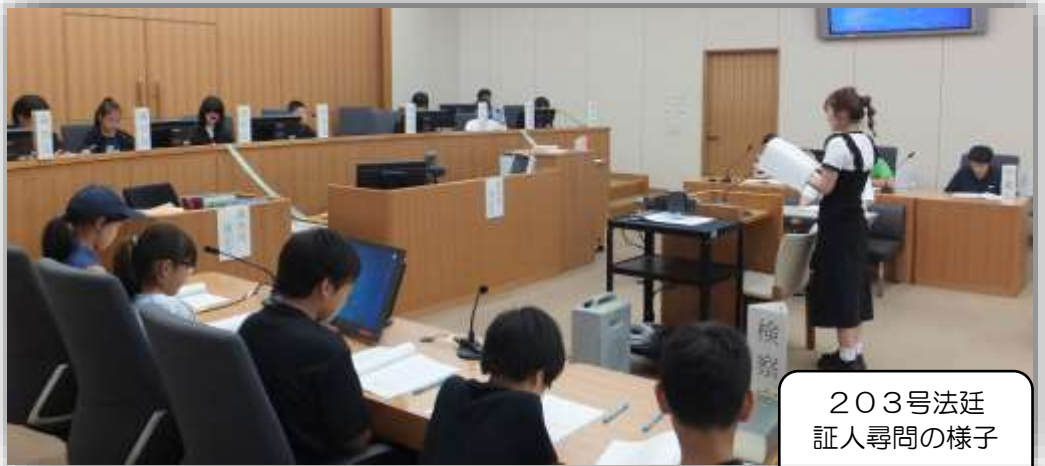
203号法廷 証人尋問の様子