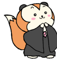
裁判所ナビゲーター 「さいたん」

広島高検・広島地検・広島法務局 広島高裁・広島地裁・広島家裁 広島弁護士会・法テラス広島 共催