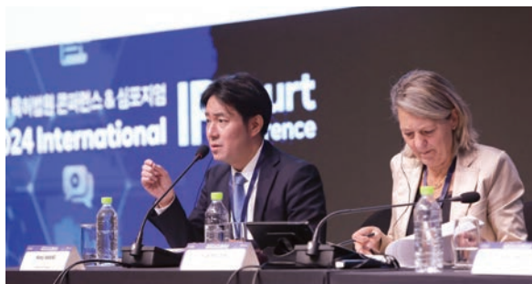
Participation in the International IP Court Conference hosted by the Intellectual Property High Court of Korea (韓国知的財産高等法院主催の国際知的財産裁判所 会議への参加)