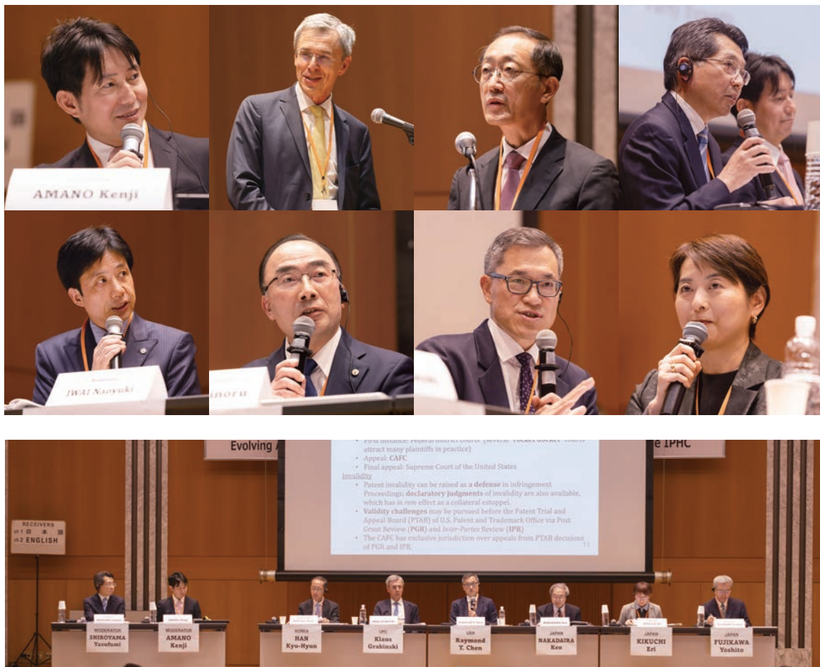
Panel Discussion in the Symposium, 2025 (パネルディスカッションの様子 JSIP2025)

日本の知的財産権関係訴訟に関する制度や運営の実情に関する情報を国内外に発信するとともに、諸外国の情報をその国の実務家から直接得られる機会として、知的財産高等裁判所は、最高裁判所、法務省、特許庁、日本弁護士連合会及び弁護士知財ネットとの共催で、国際知財司法シンポジウム (JSIP) を開催しています。