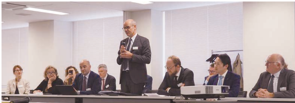
Discussion Session with members of European Patent Lawyers Association (EPLAW) (欧州特許弁護士協会所属弁護士らとの意見交換会)

国際交流や研究会等によって得られた知識や情報は、知的財産権関係事件を取り扱う裁判官同士で共有され、国際的にも通用する日本の裁判の実績に貢献しています。