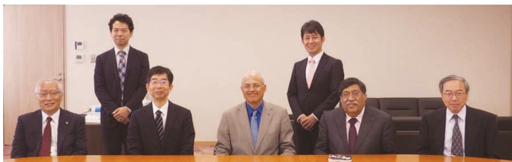
Visit by the Acting Chief Justice of the High Court of Delhi and others (デリー高裁首席判事らの来庁)