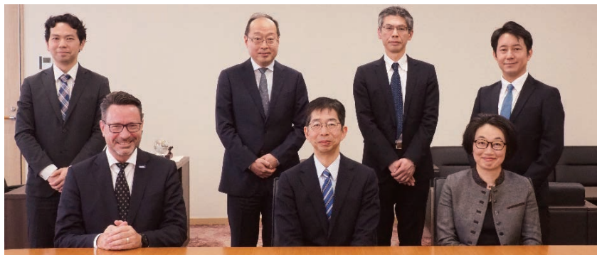
Visit by a Judge from the Munich branch of the Unified Patent Court and others (欧州統一特許裁判所ミュンヘン支部判事らの来庁)

The knowledge and information obtained through international information exchanges and the activities of study groups are shared among the judges in charge of IP-related cases, and contribute to the accomplishment of Japanese judicial decisions accepted internationally.