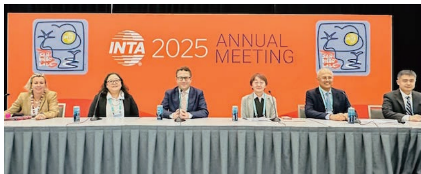
Participation in the International Trademark Association, INTA (INTA (国際商標協会) 2025年次総会への参加)

Various international conferences have been held in order to discuss the latest issues concerning IP-related litigation on intellectual property rights, which have been evolving rapidly. Judges of the Intellectual Property High Court attend those conferences and actively participate in the discussions on the latest issues and disseminate information about the practices adopted in IP-related litigation, etc. in Japan.