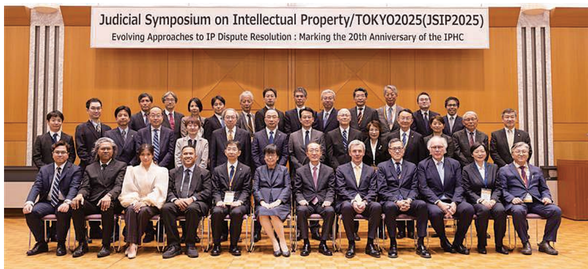
Judicial Symposium on Intellectual Property/Tokyo 2025 (令和7年度 国際知財司法シンポジウム (JSIP2025))

The Intellectual Property High Court has been hosting the “Judicial Symposium on Intellectual Property / TOKYO (JSIP)”, hosted jointly by the Supreme Court, the Ministry of Justice, the Japan Patent Office, the Japan Federation of Bar Associations, and the IP Lawyers Network Japan, as an opportunity to internationally and domestically provide information on the system and practice of IP-related litigation in Japan, as well as to obtain information on such issues in other countries directly from overseas practitioners.