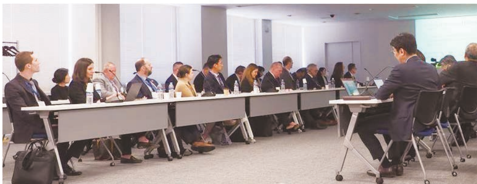
Discussion Session with members of American Intellectual Property Law Association (AIPLA) (アメリカ知的財産法協会所属弁護士らとの意見交換会)