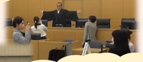
法服で記念写真撮影

〇×クイズや裁判官への質問コーナーでは参加者の方にも積極的に参加していただきました。裁判官からはとても貴重なお話を聞くことができました。