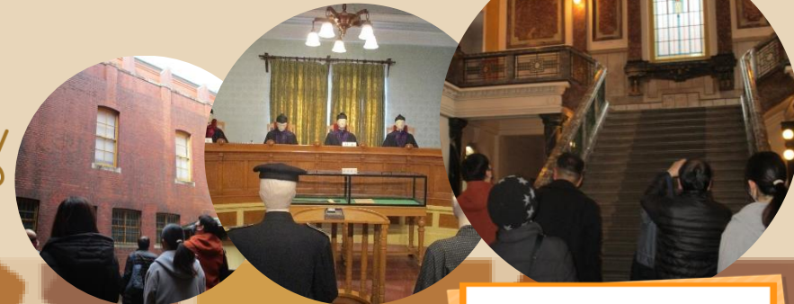
市政資料館見学の様子