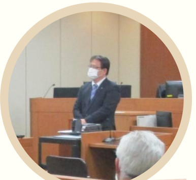
裁判官への質疑応答の様子

その後、民事部の裁判官が登場し、裁判官の仕事についての説明・質疑応答を行いました。参加者の皆様からは多くの質問をいただき、裁判所の仕事について理解を深めていただきました。