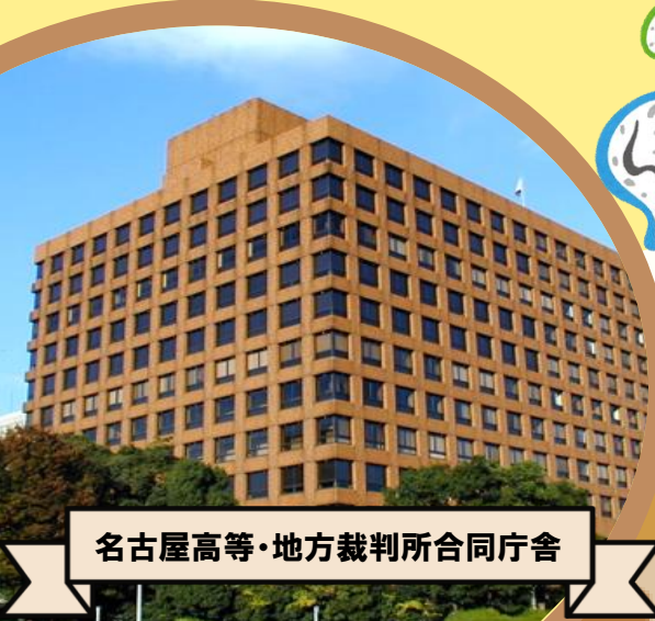
名古屋高等・地方裁判所合同庁舎

名古屋高等裁判所では、旧控訴院である名古屋市市政資料館と共催の見学ツアー『控訴院・裁判所タイムトラベルツアー』を実施しました。20代から70代の24人の方にご参加いただき、午前は名古屋市市政資料館、午後は裁判所の見学を行いました。参加者の皆様には、過去から現代にかけての法廷の変遷や裁判の歴史を肌で感じていただいたとともに、現代の裁判所の役割や仕事についても興味深く聞いていただきました。