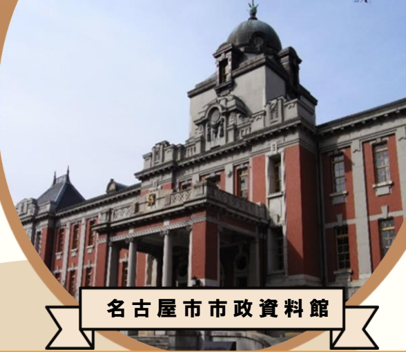
名古屋市市政資料館