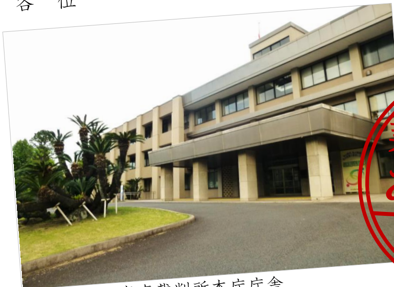
大分地方・家庭裁判所本庁庁舎