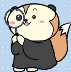
裁判所ナビゲーターさいたん