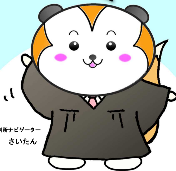
裁判所ナビゲーター さいたん