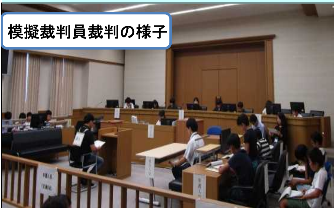
模擬裁判員裁判の様子

岡山地方裁判所では、夏休みキッズ法廷を8月6日(火)の午前と午後2回開催し、約40人の小学生の皆さんにご参加いただきました。