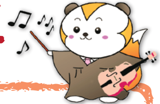
裁判所ナビゲーター さいたん