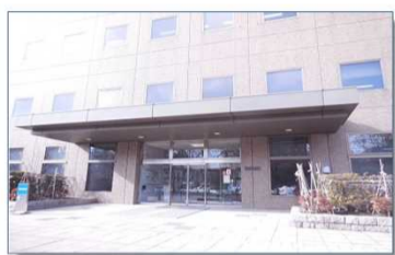
札幌簡易裁判所 正面玄関前