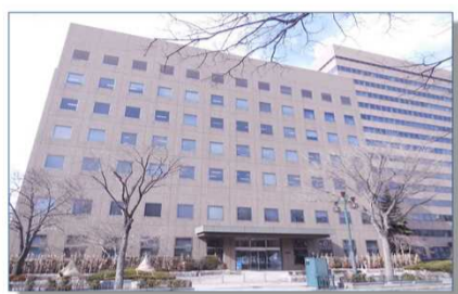
札幌簡易裁判所外観(大通公園側)