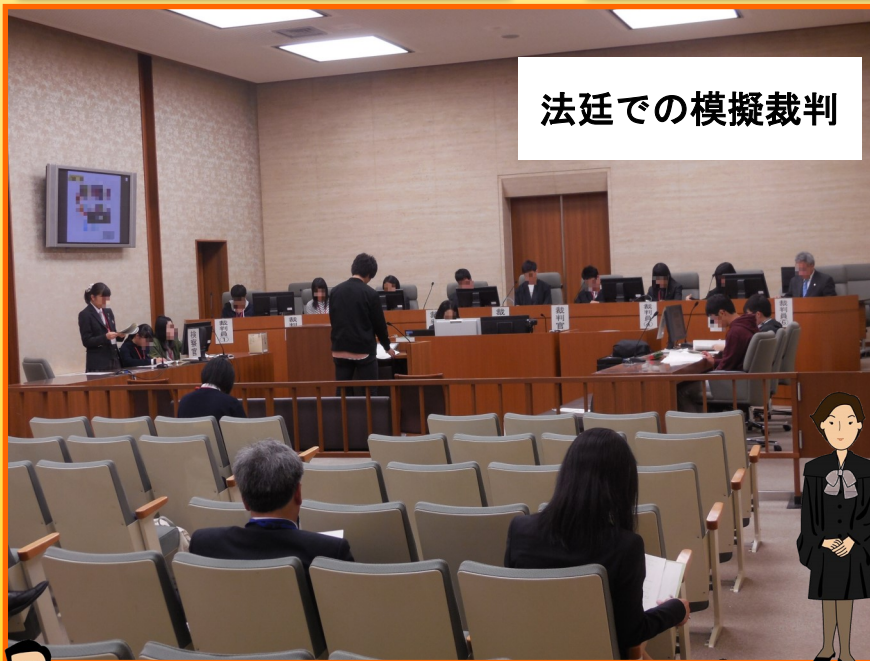
法廷での模擬裁判