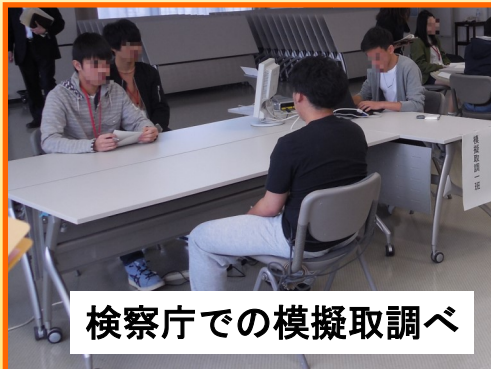
検察庁での模擬取調べ

このツアーでは，架空のスナックで起きた架空の殺人事件について，犯人逮捕後から公判・判決に至るまでの刑事手続を1日で体験してもらいました。