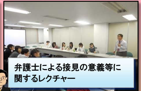
弁護士による接見の意義等に 関するレクチャー