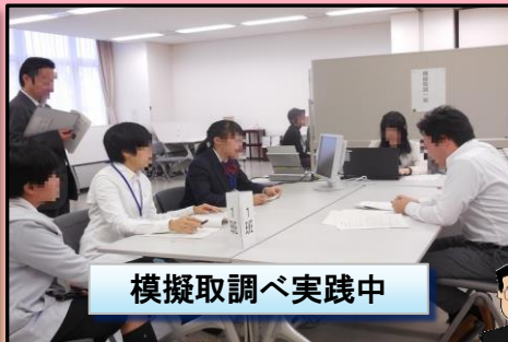
模擬取調べ実践中