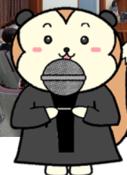
裁判官への質問コーナー