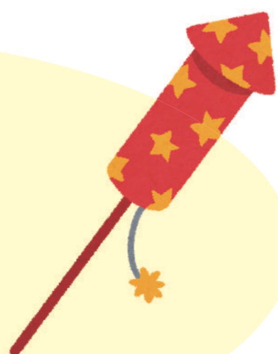
ガスボンベ、スプレー缶、火薬類