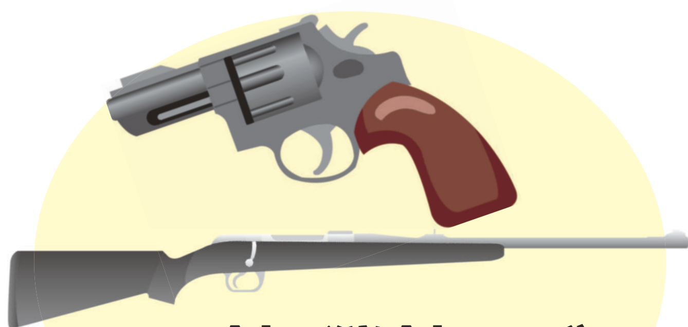
けん銃、猟銃など (模造物を含む)