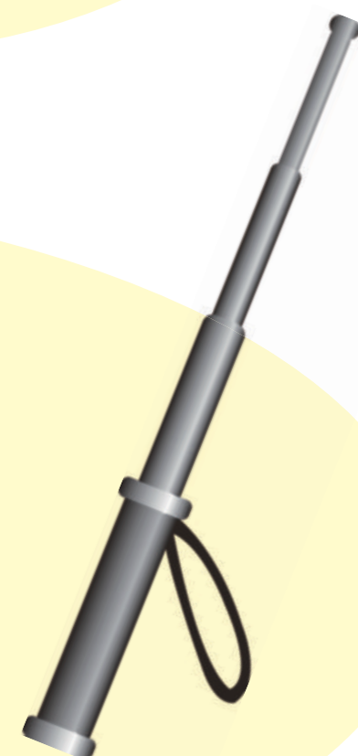
スタンガン、ヌンチャク、警棒など