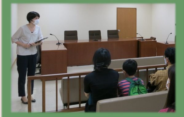
少年審判廷の見学