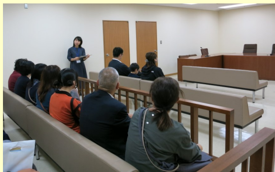
少年審判廷の見学