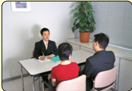
少年・保護者に対する面接調査（イメージ）

家庭裁判所調査官は、心理学、教育学などの専門知識をいかして、少年や保護者、その他の関係者と面接をするなどして、非行の原因や少年の抱える問題について調査します。