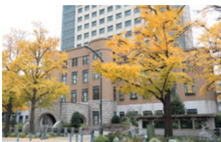
【表紙写真】 横浜地方・簡易裁判所