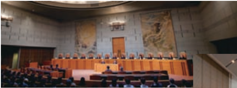
最高裁判所大法廷

最高裁判所は、終審の裁判所ですから、その裁判は最終のものとなります。その最高裁判所の法廷についてご紹介します。