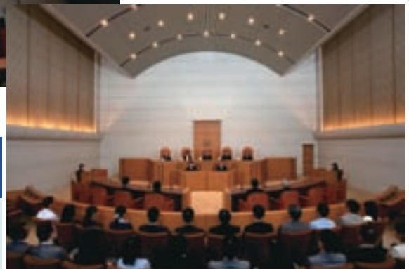
最高裁判所小法廷