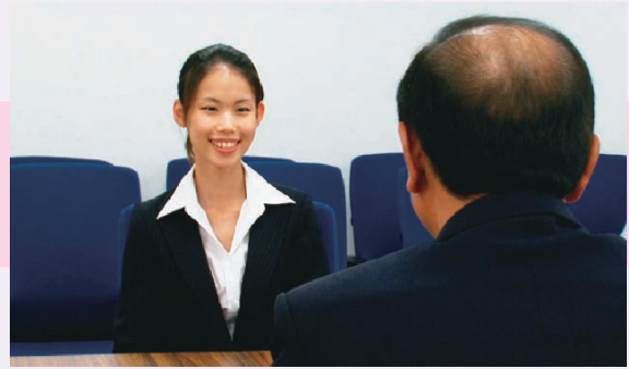
④裁判長の質問を受ける裁判員候補者の様子