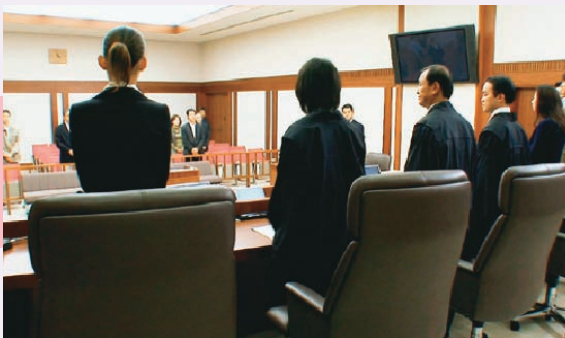
⑦審理に立ち会うため入廷する様子