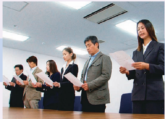
⑥裁判員が宣誓をする様子