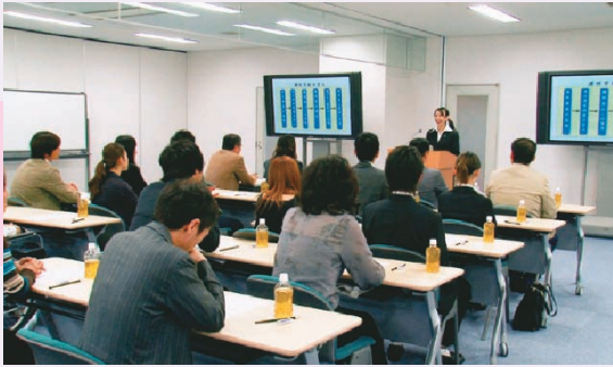
③裁判所職員による説明を聴く裁判員候補者の様子