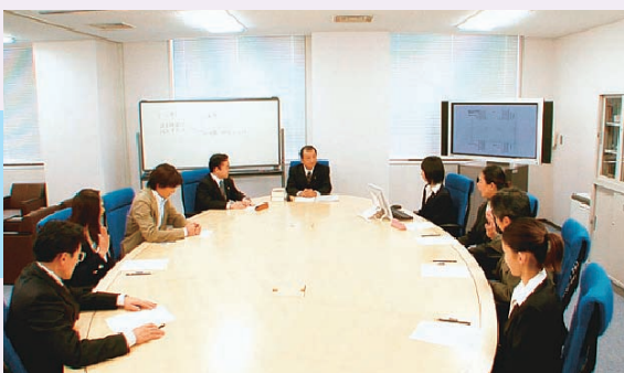
⑨裁判員と裁判官が評議する様子