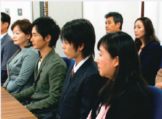
⑤集団で裁判長の質問を受ける裁判員候補者の様子