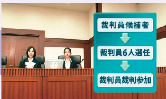
①選任手続から裁判員裁判までの全体の流れ