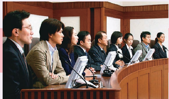
⑧法廷での審理に立ち会う様子