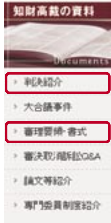
【月別判決一覧・検索画面】

また、キーワード等による検索をすることができるのはもちろん、「月別判決一覧」からは、当該年月の全判決をワンクリックで検索することができます。