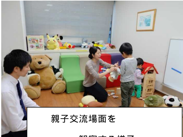
親子交流場面を 観察する様子

家裁調査官は、離婚や子どもをめぐる争いで解決を求めている方や、両親の争いのはざまに置かれている子どもと会って、その言葉や心情に耳を傾けたり、必要に応じて家庭訪問をしたりして、生活等の状況や意向を把握します。その上で、子どもの幸せを最優先にした適切な解決の方法を考え、裁判官に報告するとともに、両親にも子どもの思いを伝えたり、助言したりします。家族関係の再構築に向けて、親や子どもが新たな一歩を踏み出すための一助となることを願って取り組んでいます。