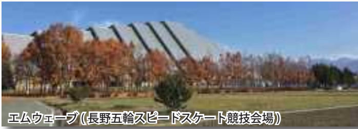
エムウェーブ(長野五輪スピードスケート競技会場)

信州の北部は、日本海に近く日本有数の豪雪地帯です。飯山簡裁庁舎の駐車場には融雪パイプが敷かれています。 平成10年に長野市を中心会場として、冬季オリンピックが開催されました。高地ゆえの寒さ、豪雪地という特性や、山という地形が活かされ、山国信州であればこそ、世界最高水準の競技会場を提供できたと言えます。世界各国の選手たちに大声援が送られ、寒い長野の冬が熱気に包まれました。現在でも、会場となった各施設では世界大会が開かれています。