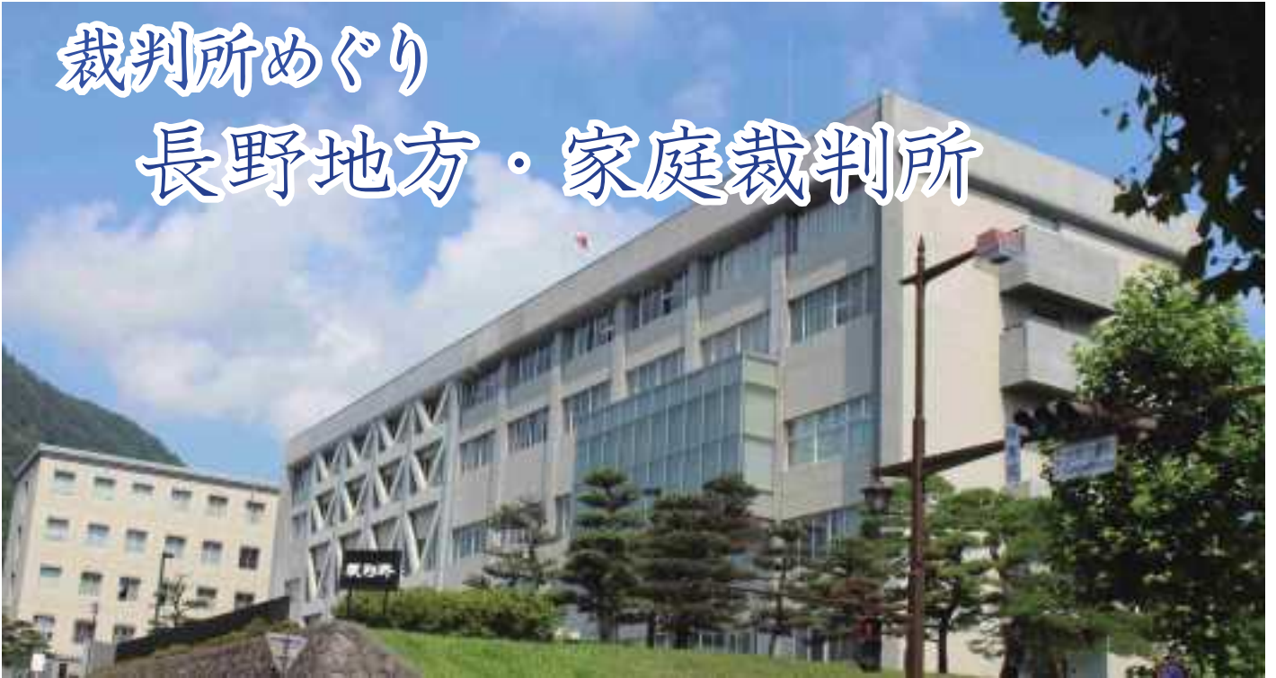
【長野地方・家庭・簡易裁判所】