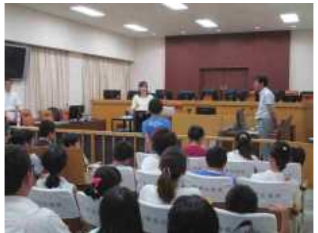
【親子見学会の様子】

山に囲まれた信州は、標高の高さや海の無い独特の風土が特徴的です。次のページでは裁判所の管轄区域ごとに「山」にスポットを当てて信州を紹介します。