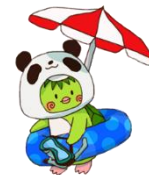
(家庭裁判所広報キャラクター)かーくん