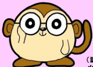
(調停制度発足100周年広報キャラクター)メガネアイ

裁判官が司会を務め、裁判所書記官と家庭裁判所調査官の意見を聞きながら、家事調停制度に関する○×クイズや三択クイズにチャレンジしました。難易度は比較的簡単なものから皆さんの頭を悩ますものまで様々ではありましたが、ロールプレイング等も挟みながらのクイズ・解説をご覧になり、家事調停制度への理解を深められたのではないかと思います。なおクイズに正解された方には、家庭裁判所広報キャラクター「かーくん」のご当地(和歌山)バージョンが描かれたカードをプレゼントさせていただきました。