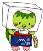
(家庭裁判所広報キャラクター)かーくん