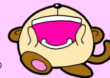
(調停制度発足100周年広報キャラクター)ハナナイアイ

クイズ終了後は、複数の班にわかれて家裁見学ツアーへ。普段は見ることのできない調停室、家事審判廷、児童室に加え、離婚訴訟などが行われる法廷もご覧いただきながら、各部屋の使用用途や設備をご紹介します。