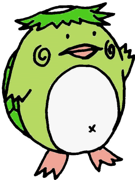
家庭裁判所のキャラクター かーくん