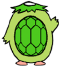
家庭裁判所のキャラクター かーくん